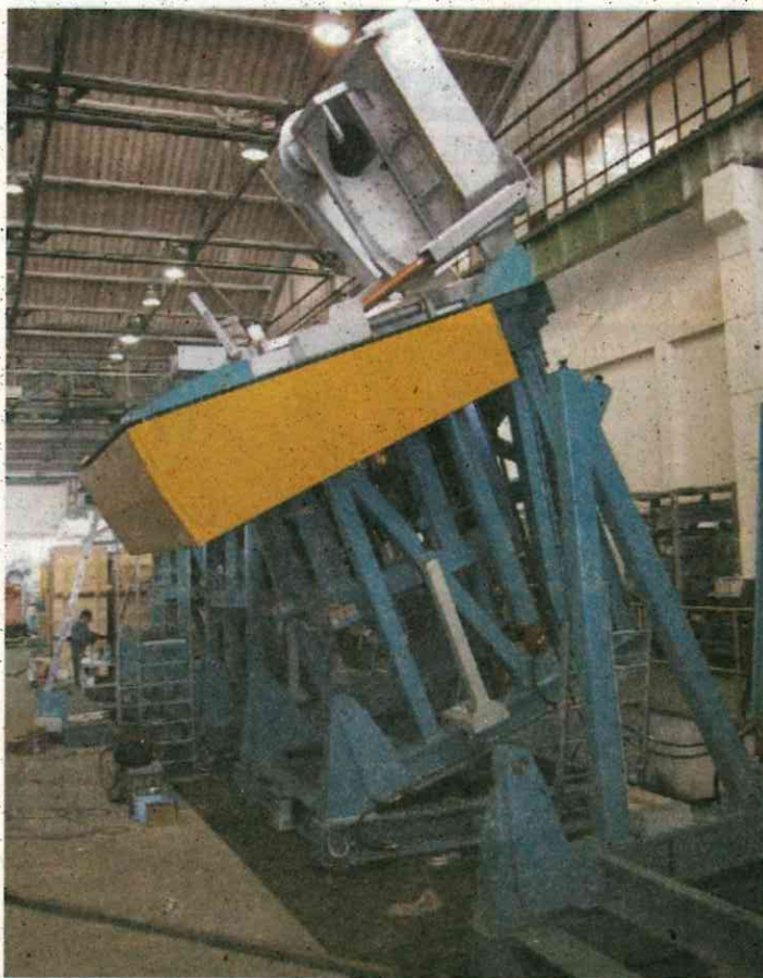
Středofrekvenční indukční tavicí pec o kapacitě 12 tun pro tavení litiny.

uplatnění u zákazníků skupiny OTTO JUNKER Group po celém světě.